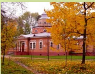
Музей-усадьба А.К. Толстого в Красном Поле

Материал о творчестве архитектора Василия Городкова находится на страницах: 6, 19, 70, 87, 145, 147, 152, 154, 184, 204, 233, 238, 260-262, 266, 280, 295, Указатель имен книги.