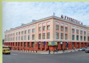
Здание Центрального универмага в Брянске

Адрес библиотеки: ул. III Интернационала, 21