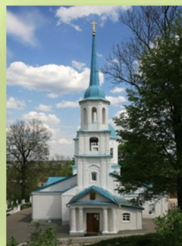
Церковь Тихвинской иконы Божией Матери в Брянске